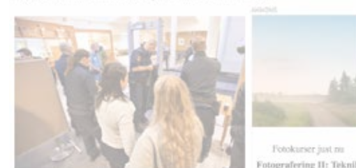
Fotokurser just nu Fotografering II: Teknik helg Erik Thor 3 750,00 kr

En av de anställda vittnade om säkerhetsåtgärder och räddade offer det som hänt.